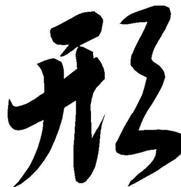
De Japanse Kanji voor Kata

Wanneer bovenstaande tekortkomingen worden geconstateerd en er verder geen grote fouten worden gemaakt in de oefening dat dient gekozen worden voor het oranje gedeelte op het scoreformulier.